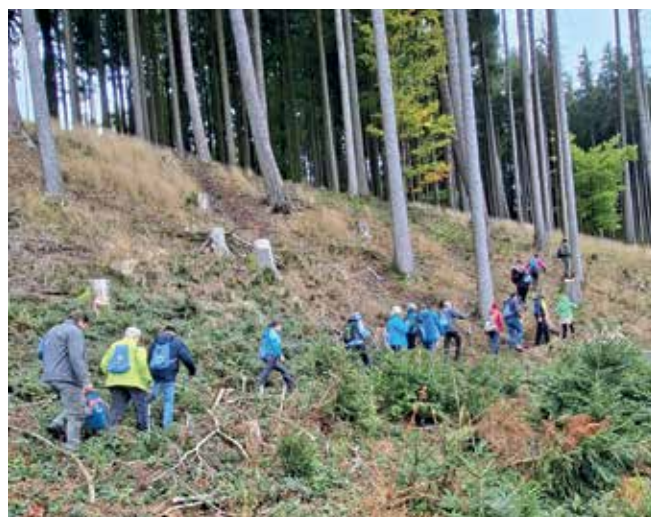
Über Stock und Stein entlang der Zeller Gemeindegrenze.