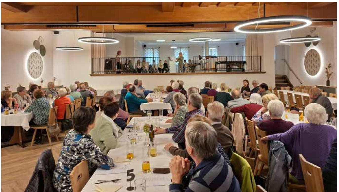
Einige Volksschulkinder umrahmten den Tag der Älteren – vielen Dank für diesen schönen Auftritt.