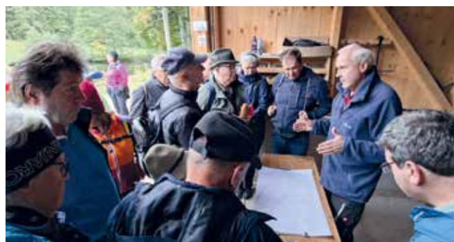
Blick auf eine alte Bergbaukarte und historische Fotos der Kohlenbahn beim „Saghannesteich“.