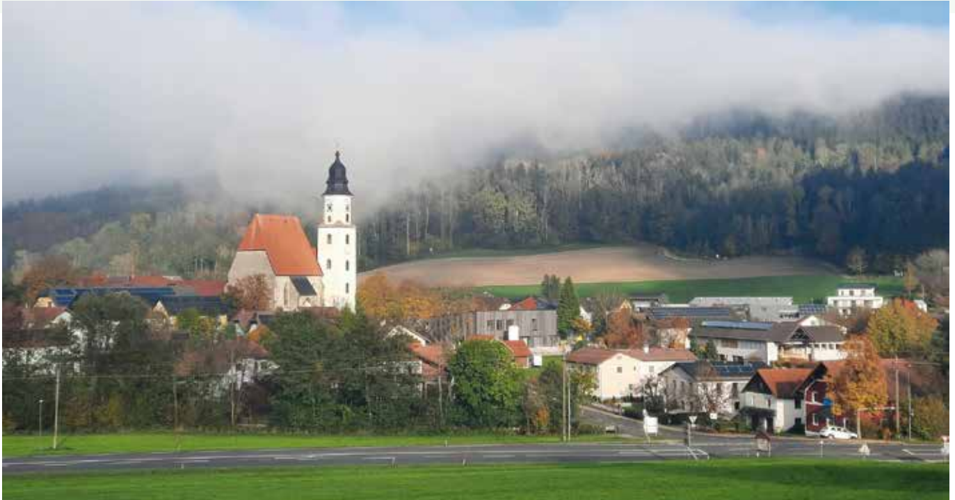
Blick auf den Ortskern.